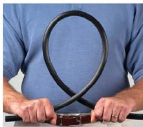
Straty wskutek tarcia złącza obrotowego

Elastyczna rura o zwiększonej odporności na zgięcia, wykonana z polietylenu o niskiej gęstości. Wytrzymuje ciśnienie do 5,5 bar.