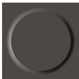
III ⚡💧🔥 0749