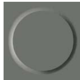
II ⚡💧🔥 0884