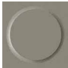
II 🔥 0007