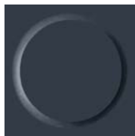
II ⚡💧 0319