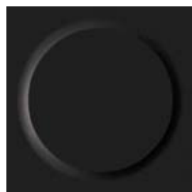
II 💧 0716