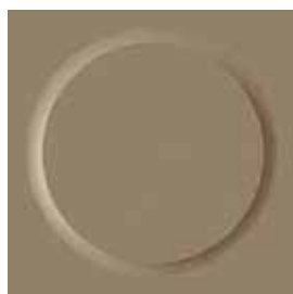
III 🔥 6172