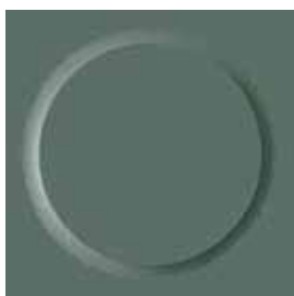
II ⚡ 0214